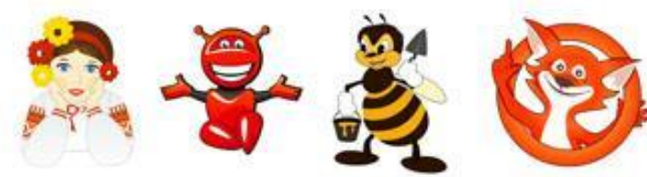
С персонажем (главным героем)